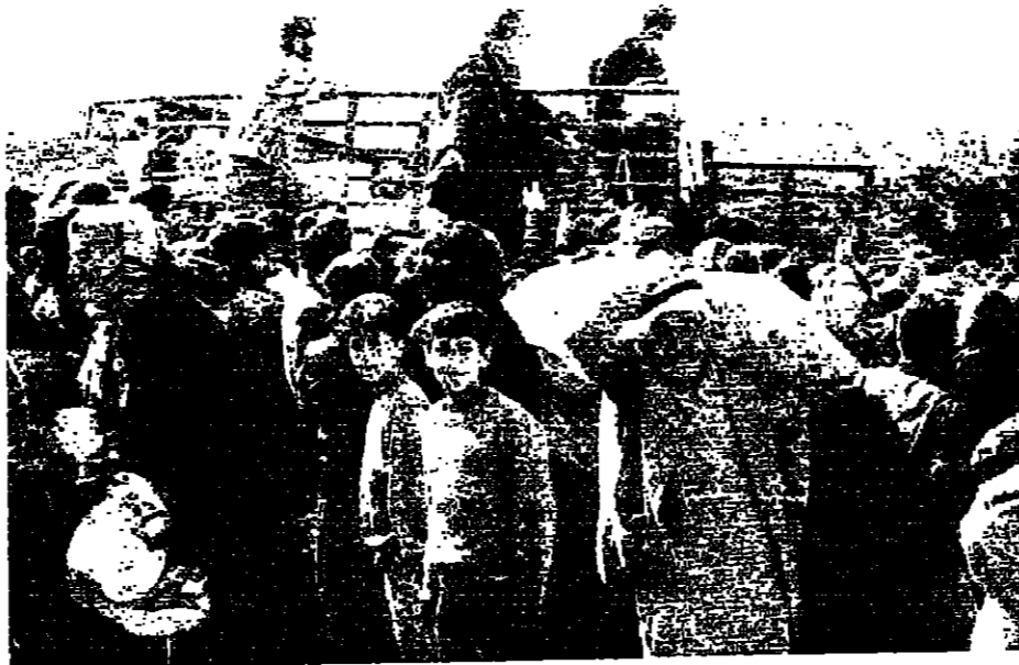
في رويسات الجديدة